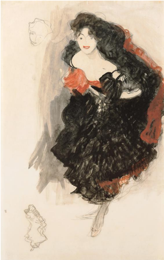
KLIMT, Gustav (1908): Study for the Painting “Judith II” . Tinta e lapis sobre papel, 54,2 x 34,5cm. Leopold Museum, Viena. / Klimt, Gustav (1908): Study for the Painting “Judith II” . Tinta y lápiz sobre papel, 54,2 x 34,5 cm. Leopold Museum, Viena

Observe con detalle o bosquejo e a obra “Judith II” de Klimt e responda ás tres preguntas seguintes sen superar, aproximadamente, 12 liñas ou 200 palabras: / Observe con detalle el boceto y la obra “Judith II” de Klimt y responda a las tres preguntas siguientes sin superar, aproximadamente, 12 líneas o 200 palabras: